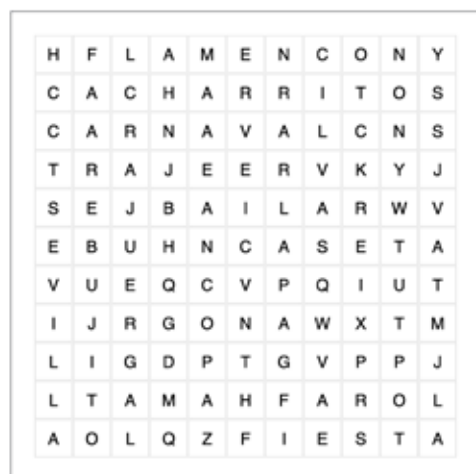
Feria de Abril

BAILAR CACHARRITOS CARNAVAL CASETA COPA FAROL FIESTA FLAMENCO JUERGA REBUJITO SEVILLA TRAJE