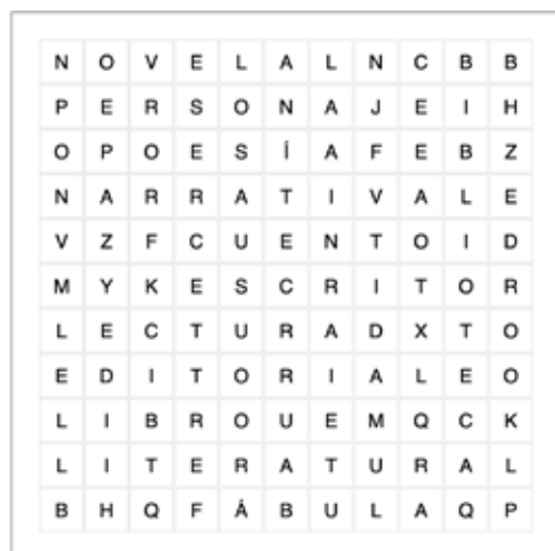
Día del Libro

BIBLIOTECA CUENTO EDITORIAL ESCRITOR FÁBULA LECTURA LIBRO LITERATURA NARRATIVA NOVELA PERSONAJE POESÍA