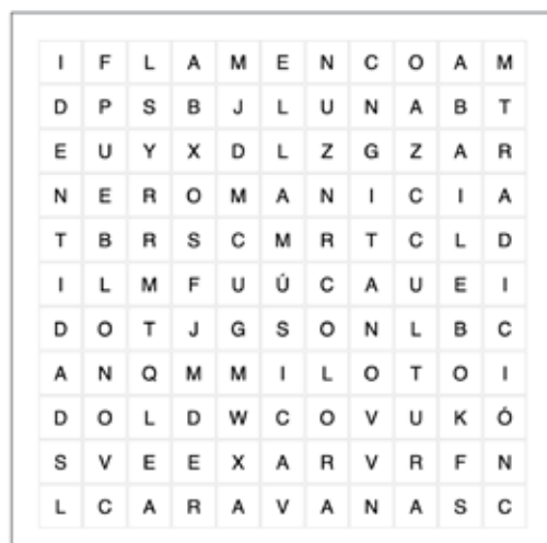
Día del Pueblo Gitano

BAILE CARAVANAS COLOR CULTURA FLAMENCO GITANO IDENTIDAD LUNA MÚSICA PUEBLO ROMANI TRADICIÓN